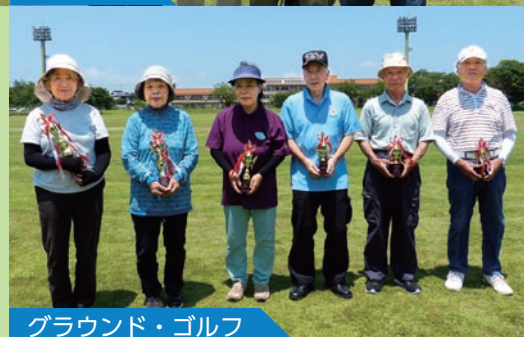
グラウンド・ゴルフ