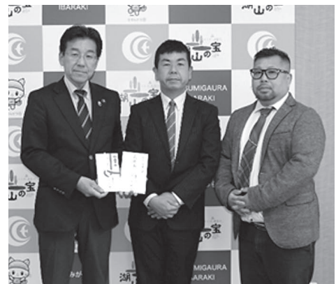
(一社) カインドネス