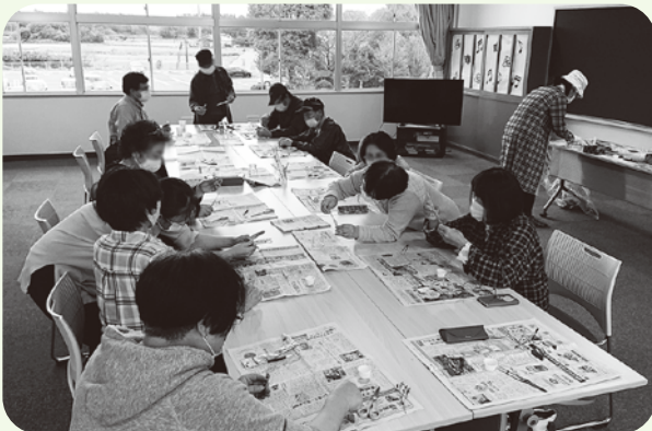
ハーバリウムボールペン作り※1