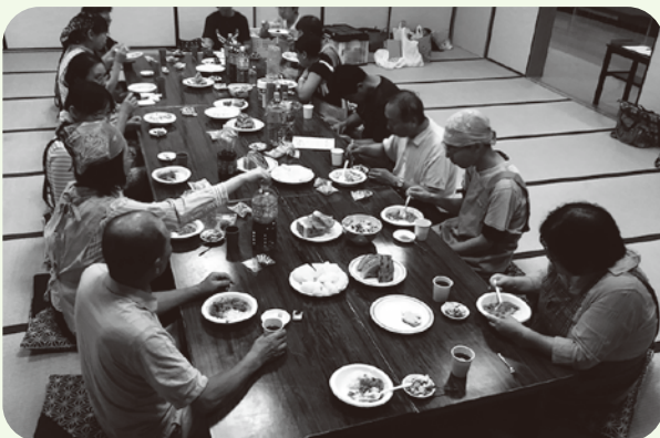
調理実習後の食事の様子※2