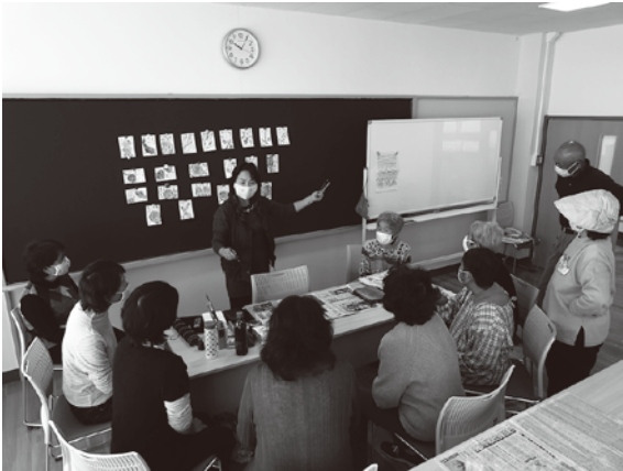
描き方について講義を受ける様子

かすみがうらウエルネスプラザにおいて、絵手紙講座を開催しました。 講座は、計4回コースで10名が参加し、色鮮やかなとてもかわいい絵手紙ができあがりました。