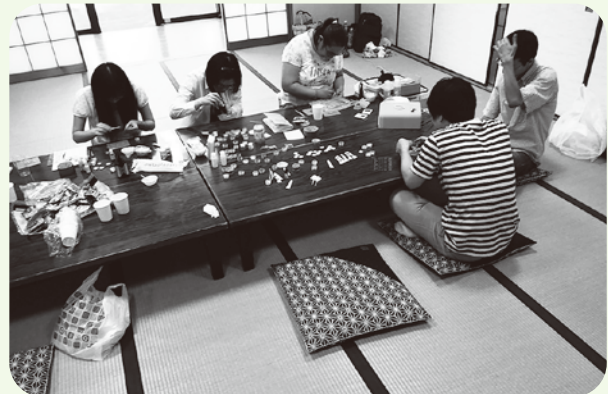
アクセサリー作り